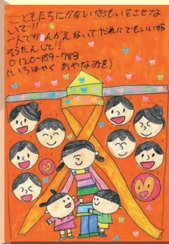
オレンジリボン公式ポスターコンテスト 2024 ユース優秀賞(漆谷 秀仁さん)