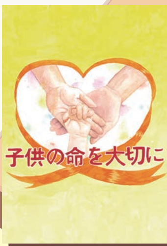
オレンジリボン公式ポスターコンテスト 2024 ユース最優秀賞(多久島 愛唯さん)