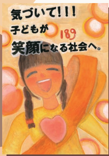
オレンジリボン公式ポスターコンテスト 2024 ユース優秀賞(阿南 夕涼さん)

「子ども虐待防止オレンジリボン運動」を広めるための啓発ポスターのデザインを広く募集いたします。